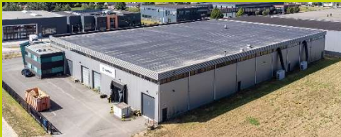
Ketelmeer 18 Oss

Op dit moment zijn we druk bezig om het nieuwe 'tijdelijke' pand van herinzet gebruiksklaar te maken. Dit tijdelijke pand wordt aangepast zodat we veilig onze werkzaamheden hier kunnen uitvoeren. Zo wordt het buitenterrein verhard, voor compactstations en milieustraat, wordt de elektra aangepast en de vloer gecoat (voor de opslag van transformatoren). Het zijn kleine aanpassingen die binnen een korte termijn moeten plaats vinden. De ingebruikname van de werkplaats staat gepland voor week 34. Hier zullen we de komende tijd ook druk mee zijn.